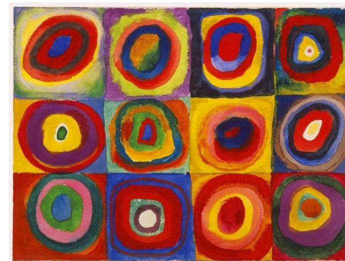
Artista Wassily Kandinsky

Edizione 2023 Evento ECM N° 352 - 381706